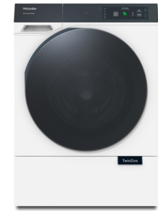
WEB375 WPS PWash&8kg